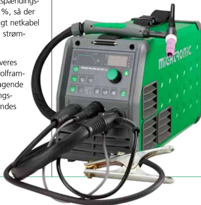
Ret til ændringer forbeholdes.