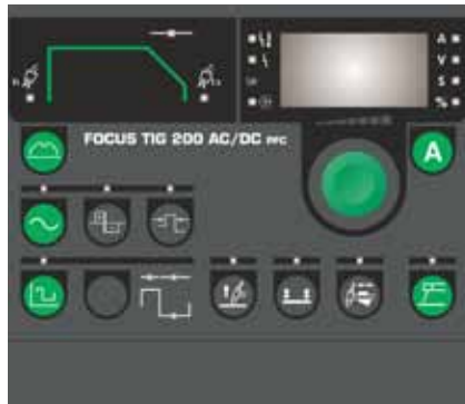
Betjeningspanel til Focus TIG 200 AC/DC PFC

svejsning med ca. 25% højere svejsestrøm på kun 16 A netsikringer.