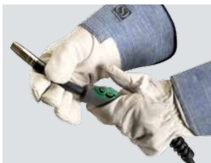
ML 161-241 - superergonomiske svejseklanger med 360° drejelig svanehals.